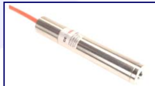
Piezómetros de Cuerda Vibrante