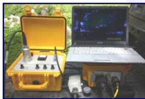
Sismógrafo o Geode